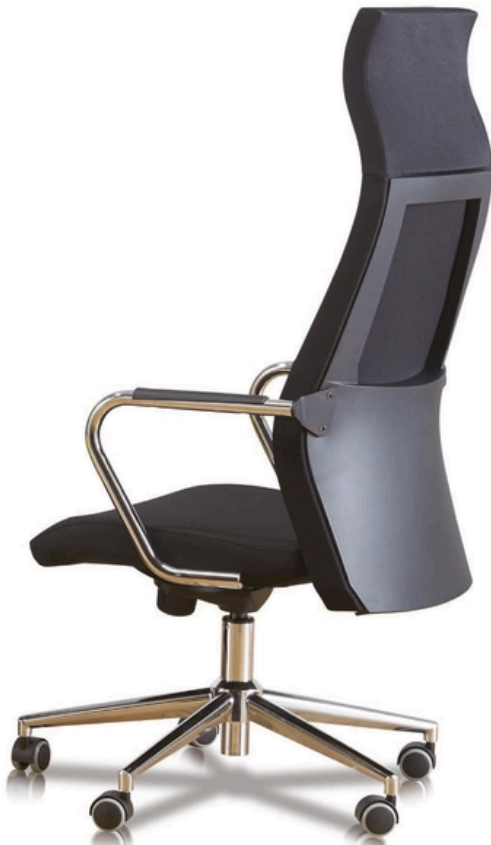
LA FOTO PUO' INCLUDERE OPTIONAL